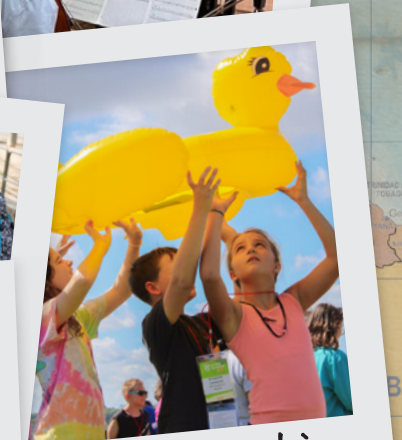
Rejwenn Pwochè Jenerasyon an