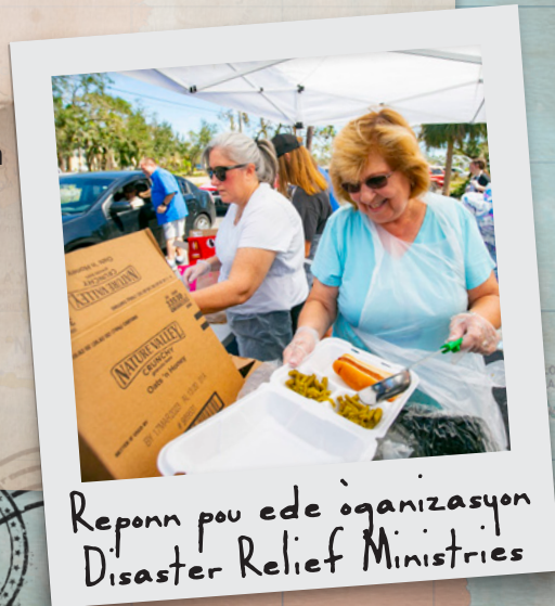
Reponn pou ede òganizasyon Disaster Relief Ministries

Se lajan w bay nan pwogram kooperativ la ki rann jefò sa yo posib pou wayòm nan, nan tout Eta a.