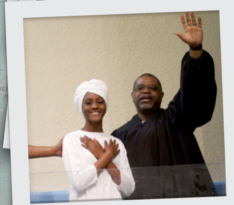
Selebre Nouvel Vi!